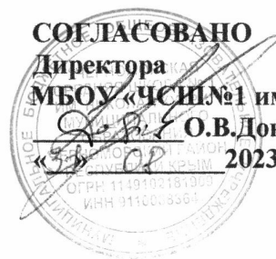
ГРАФИК ПИТАНИЯ ОБУЧАЮЩИХСЯ

Муниципального бюджетного общеобразовательного учреждения «Черноморская средняя школа № 1 им. Николая Кудри» муниципального образования Черноморский район Республики Крым 2023/2024 учебный год