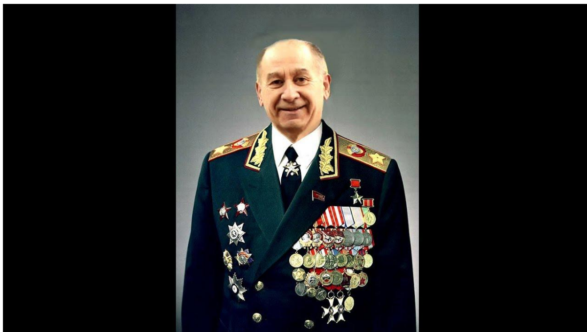
Рисунок 5 — Портрет Сергея Леонидовича Соколова, министра обороны СССР