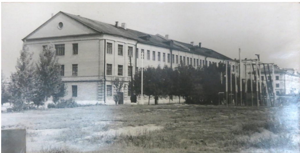
Рисунок 2 — Здание военного учебного заведения, связанное с подготовкой к службе в бронетанковых войсках

ответственные решения и эффективно руководить подчинёнными. Полученные знания стали фундаментом для успешной службы.