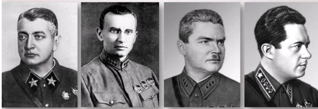
М.Н. Тухачевский 1893–1937 гг.