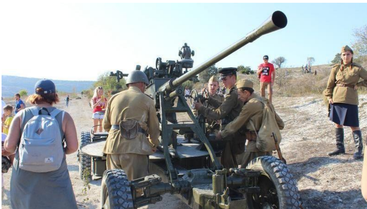
Рисунок 6 — Военно-историческая реконструкция с участием техники, отражающая патриотическое воспитание и сохранение исторической памяти в Крыму.

Таким образом, историко-культурное значение Сергея Леонидовича Соколова выходит за рамки личных заслуг и военной славы, становясь важным элементом локальной идентичности и патриотического воспитания. Так формируется память поколений, основанная на уважении к героическому прошлому и ответственности за будущее Родины.